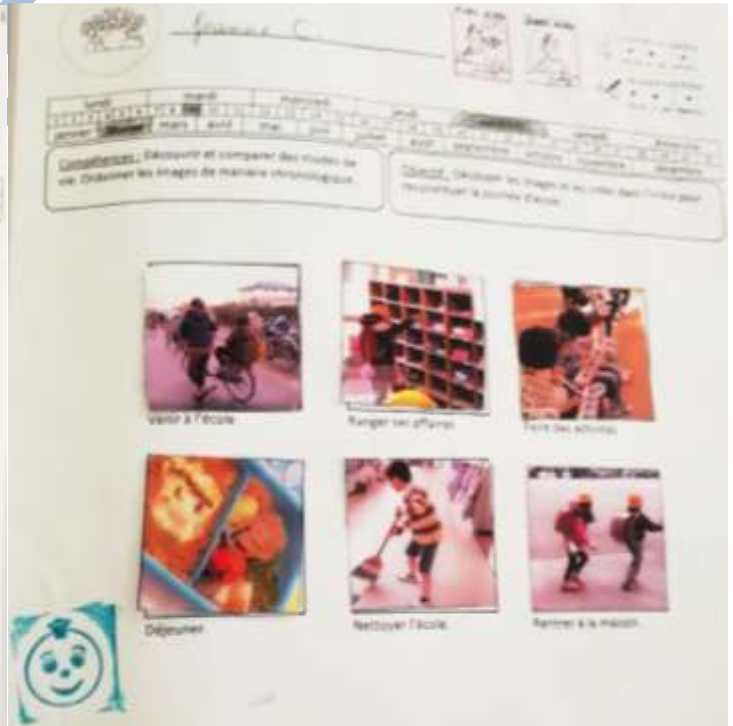
Fiches chronologiques réalisées suite à la séance 4 sur les écoliers japonais.