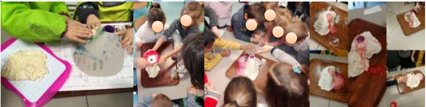
Fabrication de volcans en pâte à sel. Réalisation d'une éruption chimique (vinaigre blanc, bicarbonate, colorant).