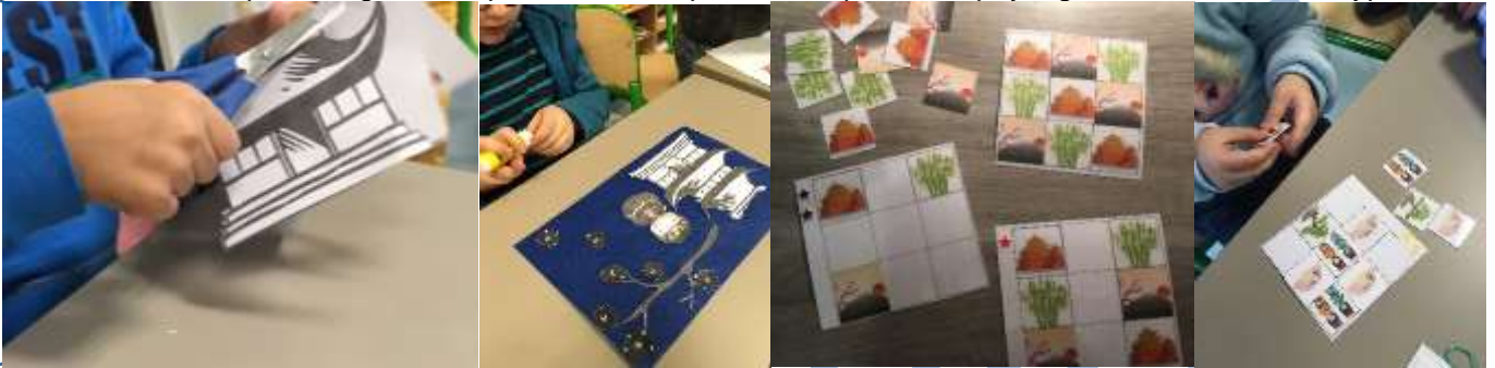
Réalisation d'un décor japonais, sudokus, placement sur quadrillages, tangrams.