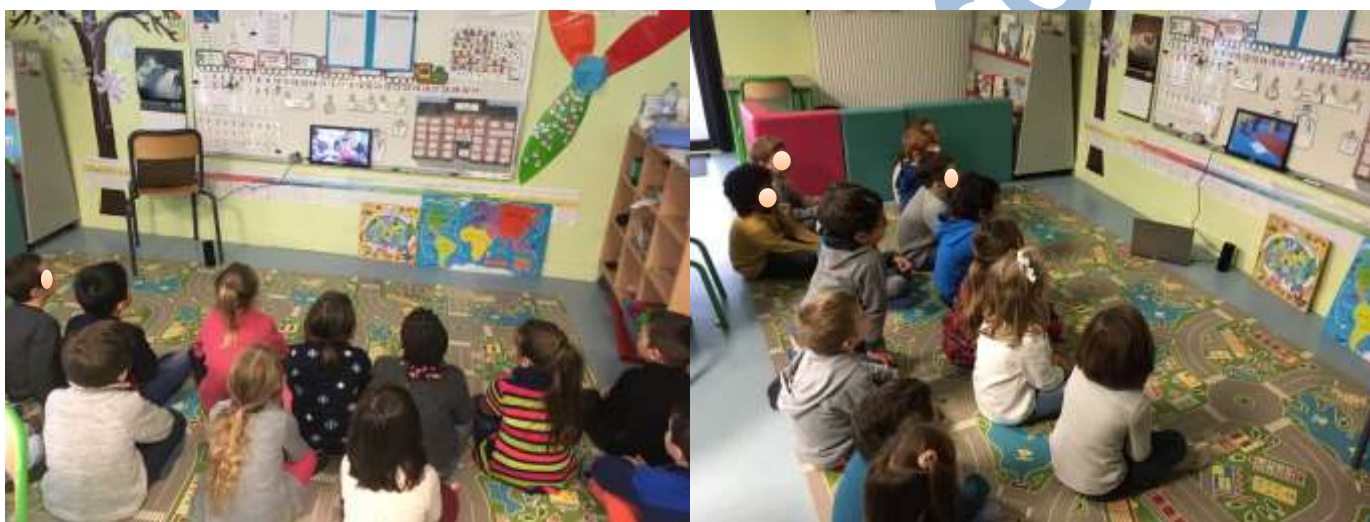
Visionnage du reportage