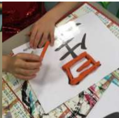
Calligraphie en pâte à modeler