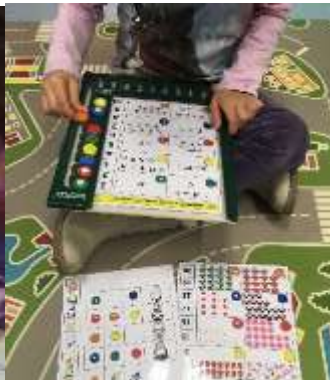
Tableau à double entrée.