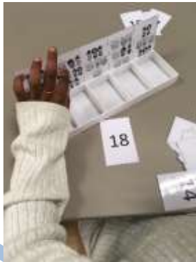
Dénombrement sur carte ou avec la boîte à compter.