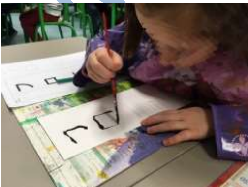
Ecriture du prénom en katakana.