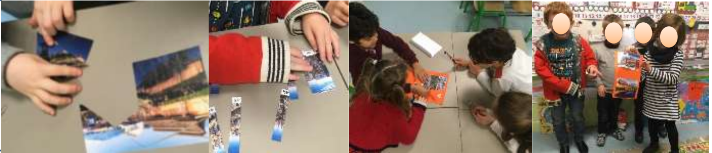
Reconstitution de puzzles géométriques et numériques, description des paysages, vérification des hypothèses.