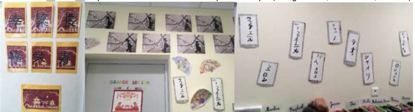
« Bonne année »