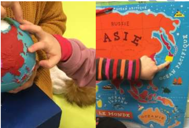
Situer le Japon sur un globe et un planisphère.

Affichage des hypothèses des élèves selon les cinq thèmes : paysages, habillement, habitat, nourriture et vie quotidienne.