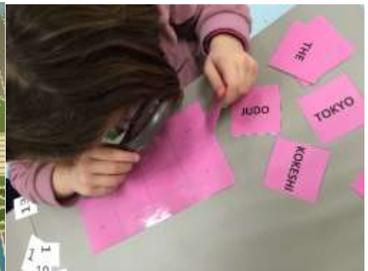
Jeu de la loupe (mots du Japon).