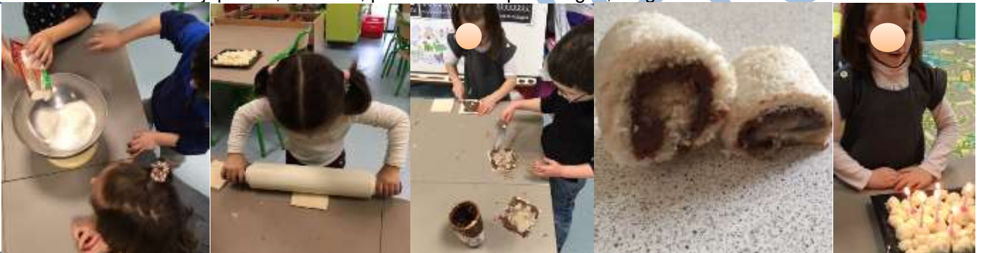
Réalisation de boules coco et de makis coco-banane-Nutella® pour les anniversaires de janvier.