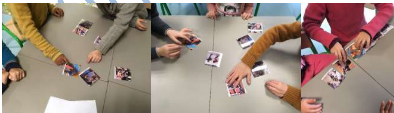
Manipulation des images issues du film, à ranger chronologiquement (plusieurs jeux d'images différentes).